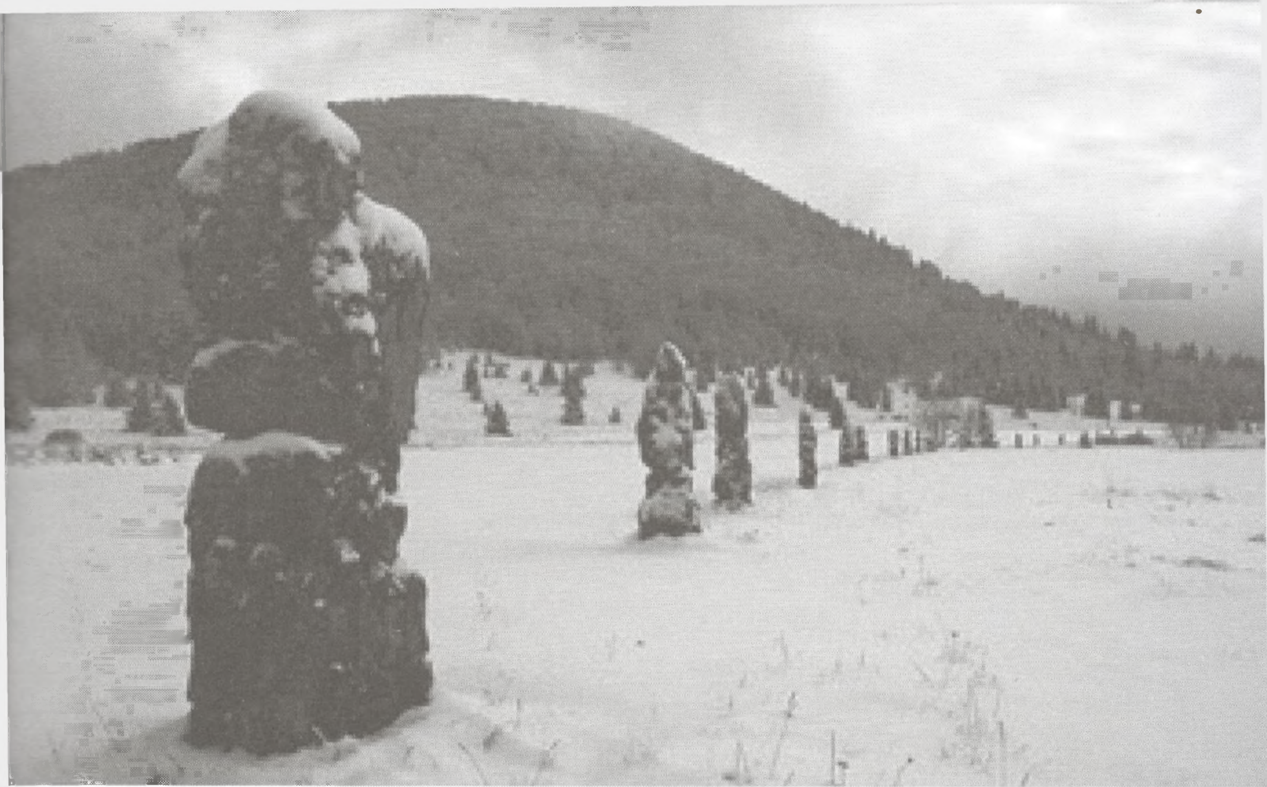
Matić poljana, 26 kamenih monolita u spomen na 26 smrznutih partizana (idejni koncept inž. Zdenko Sila)

borci i ranjenici nužno su trebali tople i suhe prostore za oporavak i povrat snage da bi mogli nastaviti sa žestokim borbama koje su neprekidno vodili s njemačkim snagama i domaćim izdajnicima.