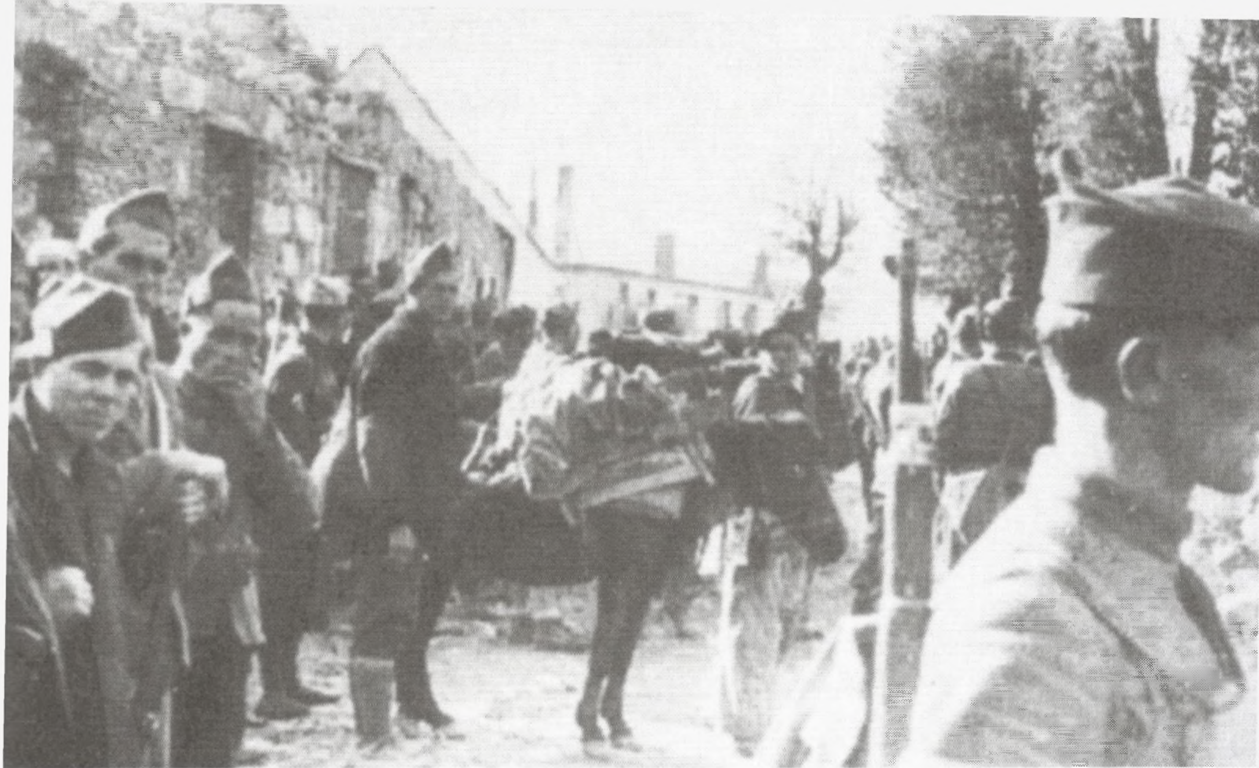
Osnivanje 6. primorsko-goranske brigade u Drežnici 12. listopada 1942.

Jugoslavije. Kroz NOV i PO Hrvatske u istom je razdoblju prošlo preko 250 tisuća boraca koji su učestvovali u svim velikim bitkama na prostoru Hrvatske i bivše Jugoslavije. Od tog broja njih preko 70% bili su Hrvati.