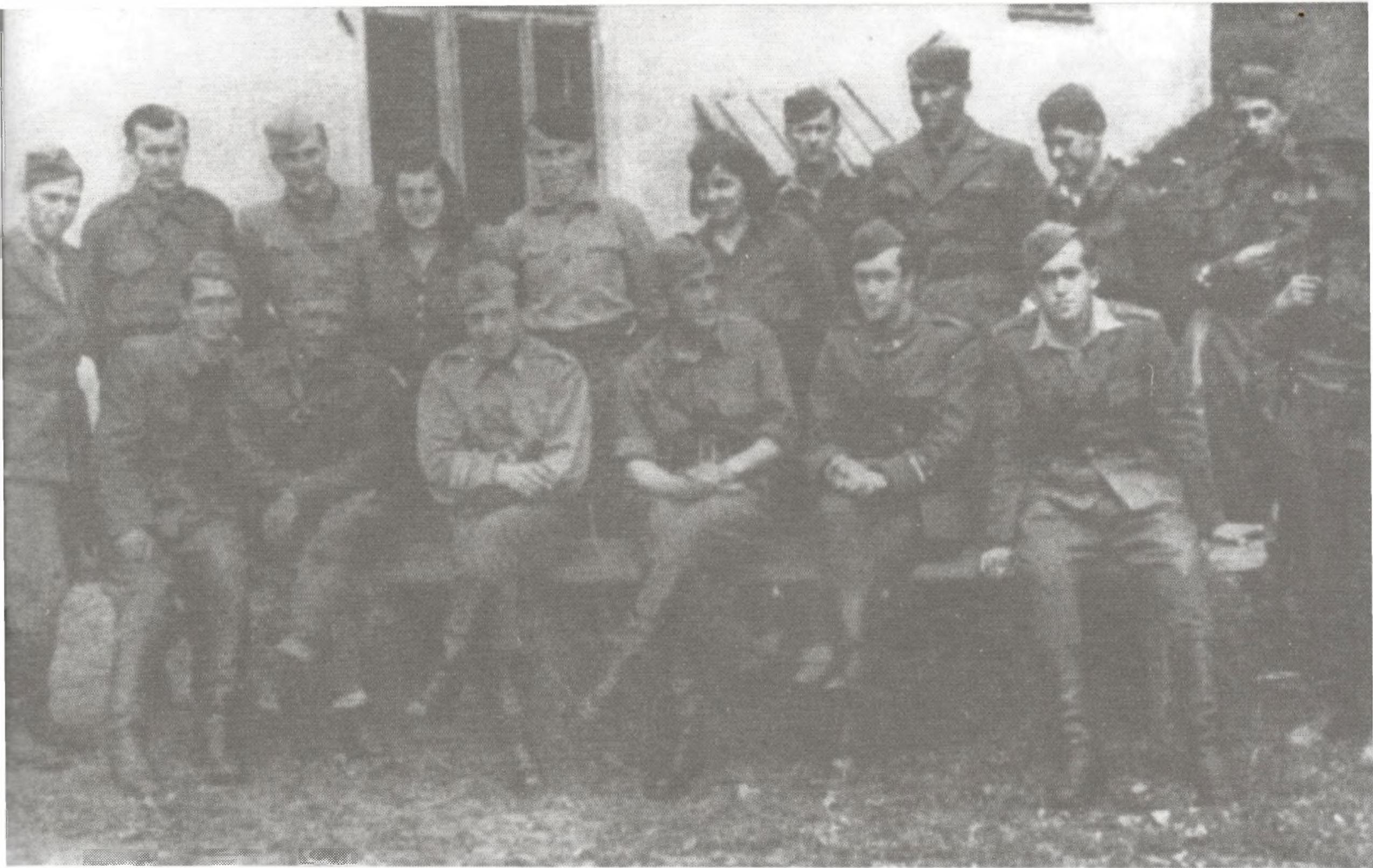
Štab 13. PGU divizije u selu Tiči, Gorski kotar, u travnju 1944.

Upravo zato da bi se izbjegla sva ova povijesna zastranji- vanja o tim danima slave i ponosa treba progovoriti objek- tivno i hladne glave, kako zbog tisuća onih koji su dali svoje živote u toj borbi tako i zbog njihovih nasljednika koji su se s jednakim žarom borili u Domovinskom ratu, ali i ge- neracija koje dolaze i dobivaju iskrivljenu povijesnu sliku ne snalazeći se više ni tko je protiv koga ratovao ni zašto. Upravo zato danas Savez antifašističkih boraca i antifaši- sta Hrvatske inzistira ne na formalnom obilježavanju ob- ljetnica iz NOR već na suštinskom razumijevanju tih ob- ljetnica i pojašnjenju značaja takvih događaja, što je izu- zetno važno, posebno za mlađe generacije.