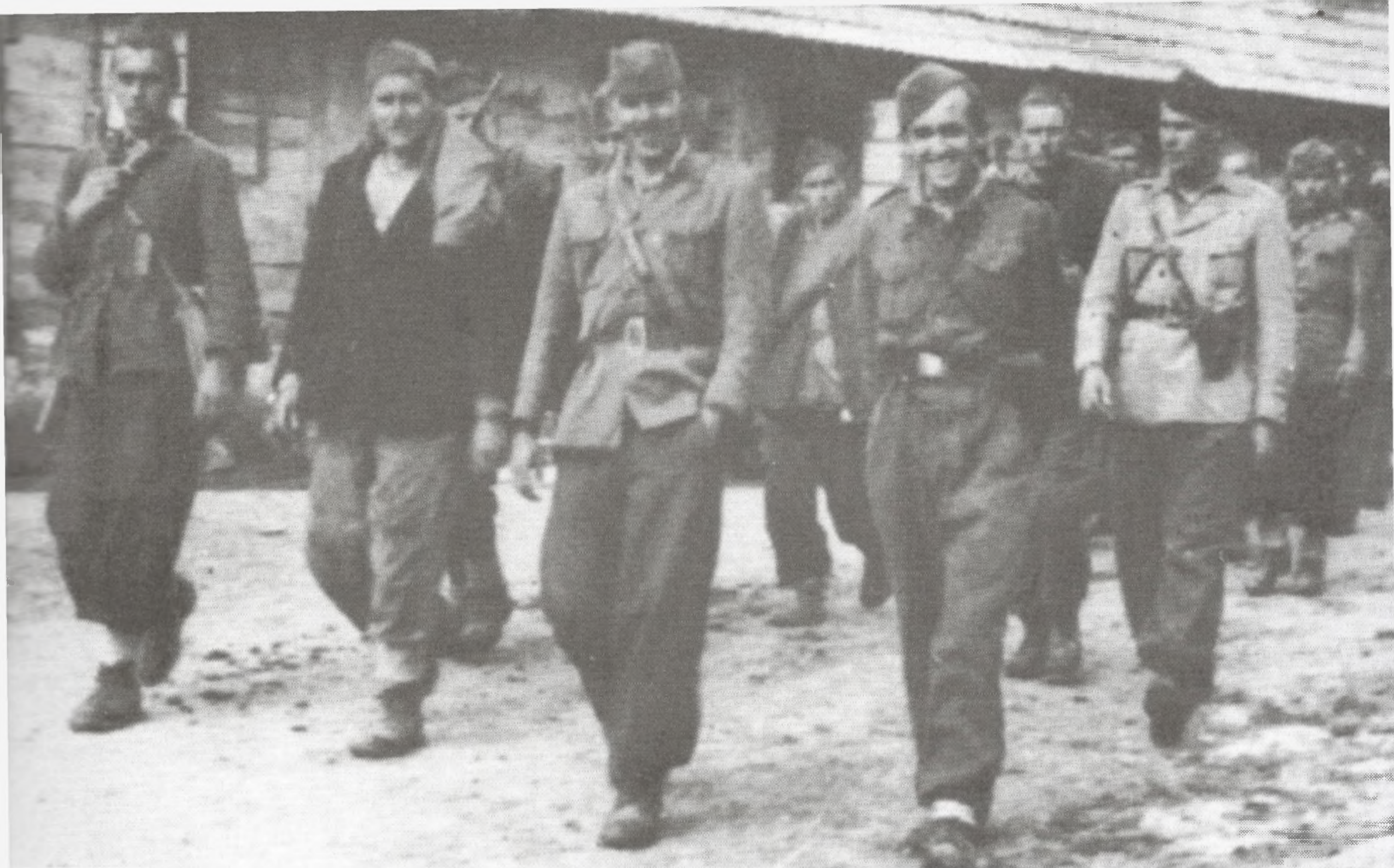
Bataljon "Matija Gubec" na maršu 1944.

čini sve kako bi likvidirala XIII. Primorsko-goransku diviziju, no bez uspjeha. Ako i uspije odbaciti snage XIII. Primorsko-goranske divizije na pojedinom području na dan ili dva onda borci ove proslavljene jedinice uzvraćaju na drugom mjestu nanoseći velike ljudske i materijalne gubitke. Pokazalo se da je XIII. Divizija daleko pokretljivija, vitalnija, ali i da ima slobodu manevriranja i neprekidnu inicijativu na terenu.