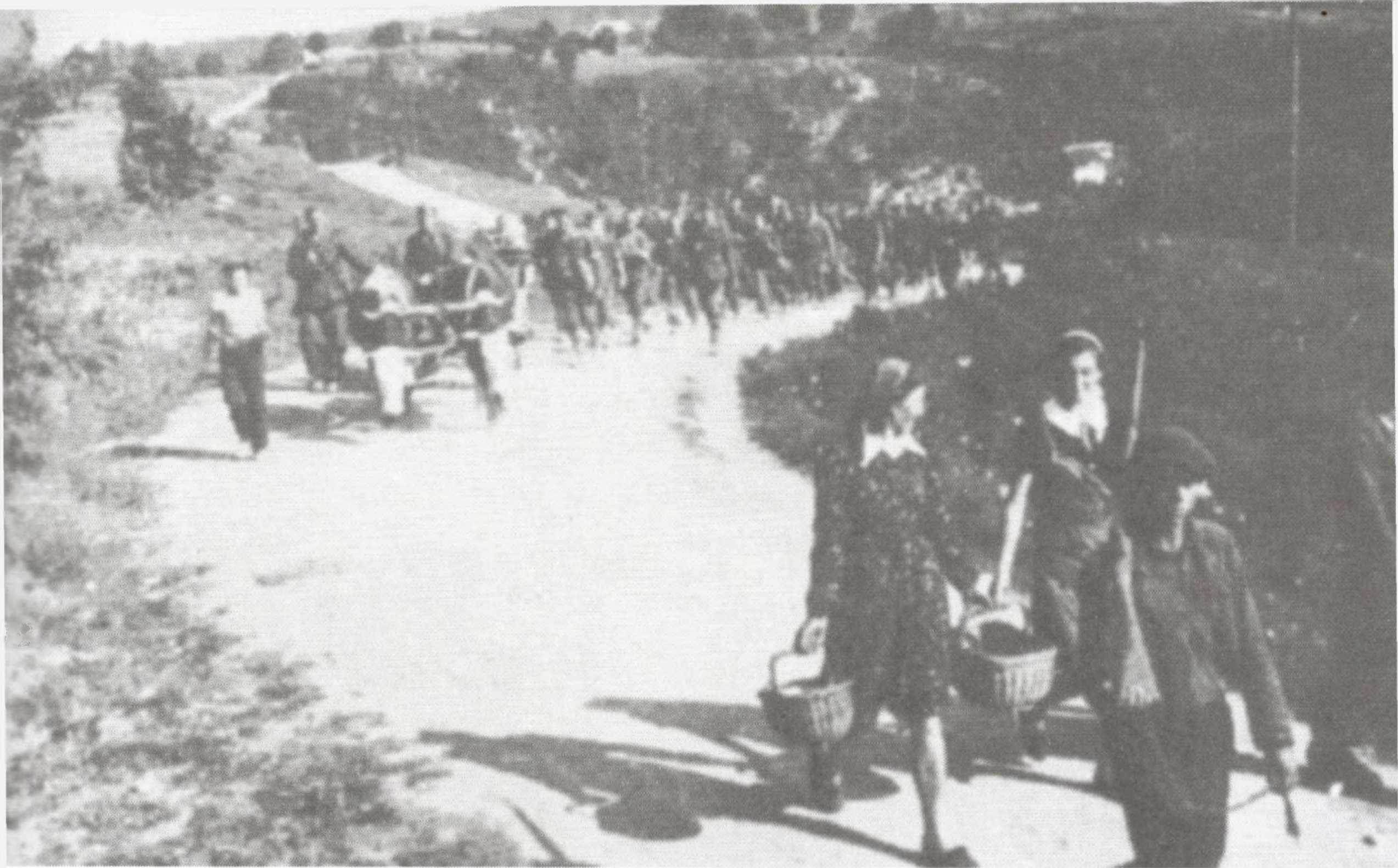
Prijevoz hrane zapregama

nika prenese u Drežnicu i tamo liječi. Danas je gotovo nezamislivo da izgladnjeli ljudi mogu opstati i preživjeti danima na velikoj hladnoći, snijegu, ledenoj kiši, bez hrane i lijekova istodobno prenoseći i po stotinjak kilometara veliki broj teških ranjenika kroz bespuća i visok snijeg.