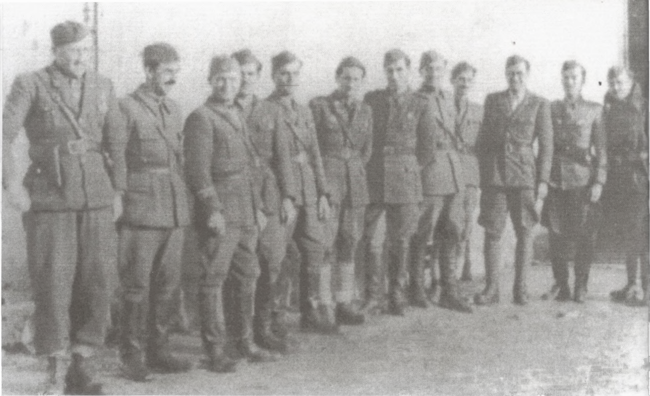
Štab 11. korpusa u Kuželju 1944.

nije rezultate. Nijemci su minirali morske putove, utvrđivali obalu protiv desanta, predviđali masovno rušenje lučkih i obalnih postrojenja u slučaju iskrcavanja Saveznika, planirali intervencije protiv zračnih desanata i prekidanje komunikacija prema Zagrebu i Ljubljani. No, svi ti napori nisu imali naročitog efekta jer su borci XIII. Primorsko-goranske divizije neprekidno bili tu, napadali i ometali sve njemačke napore, a naročito glavni – likvidirati partizanske snage na tom području. Silan elan boraca XIII. Primorsko-goranske divizije došao je dodatno do izražaja u proljeće 1944. kada je GŠNOV Hrvatske (od 23. veljače do 23. travnja 1944.) organizirao dvomjesečno natjecanje partizanskih jedinica u kojem je XIII. Primorsko-goranska divizija zauzela prvo mjesto u 11. Korpusu NOV Jugoslavije.