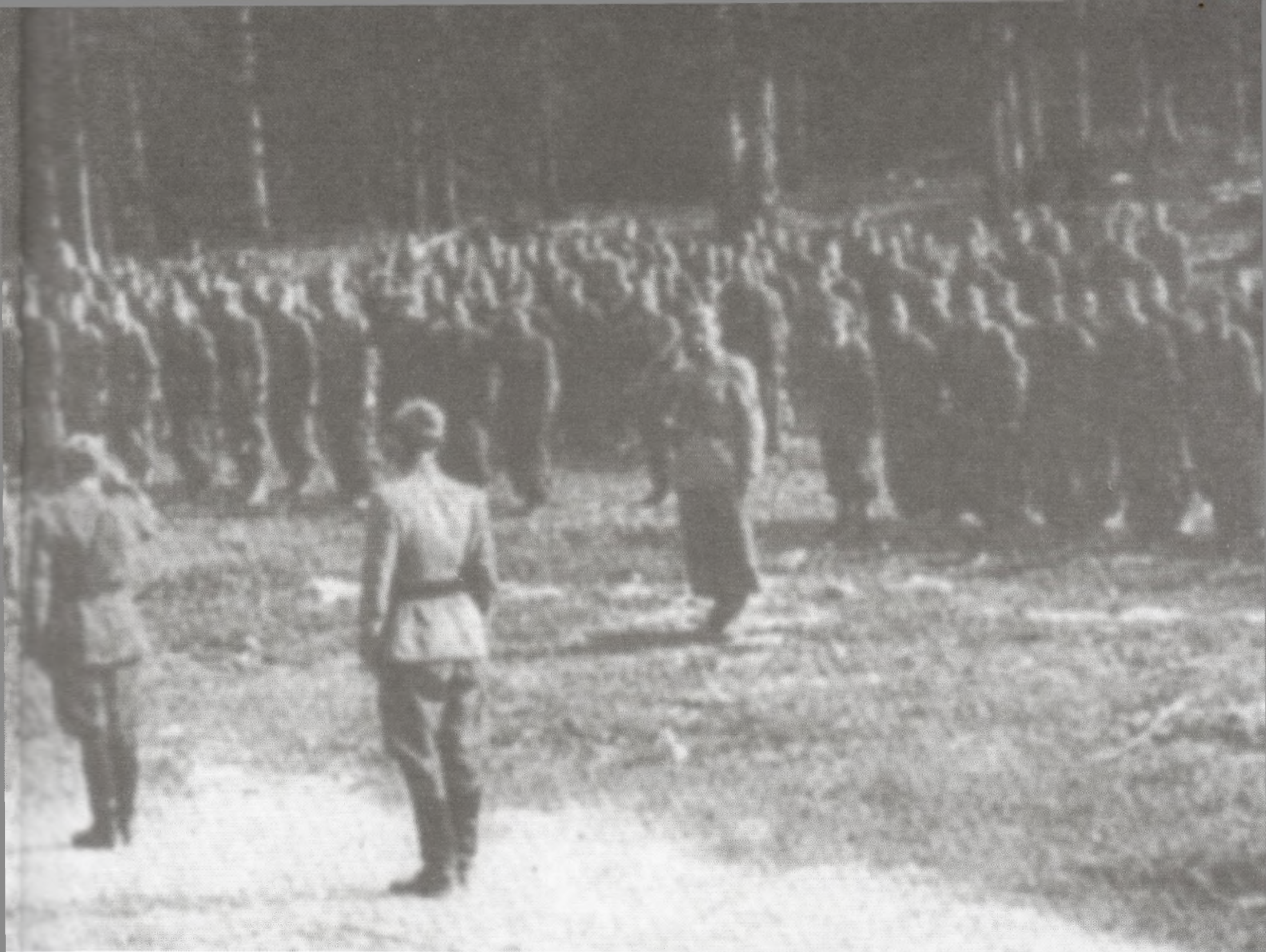
Formiranje 3. brigade 13. PG divizije kod Delnica 25. srpnja 1944. (gore). Orden narodnog heroja (lijevo).