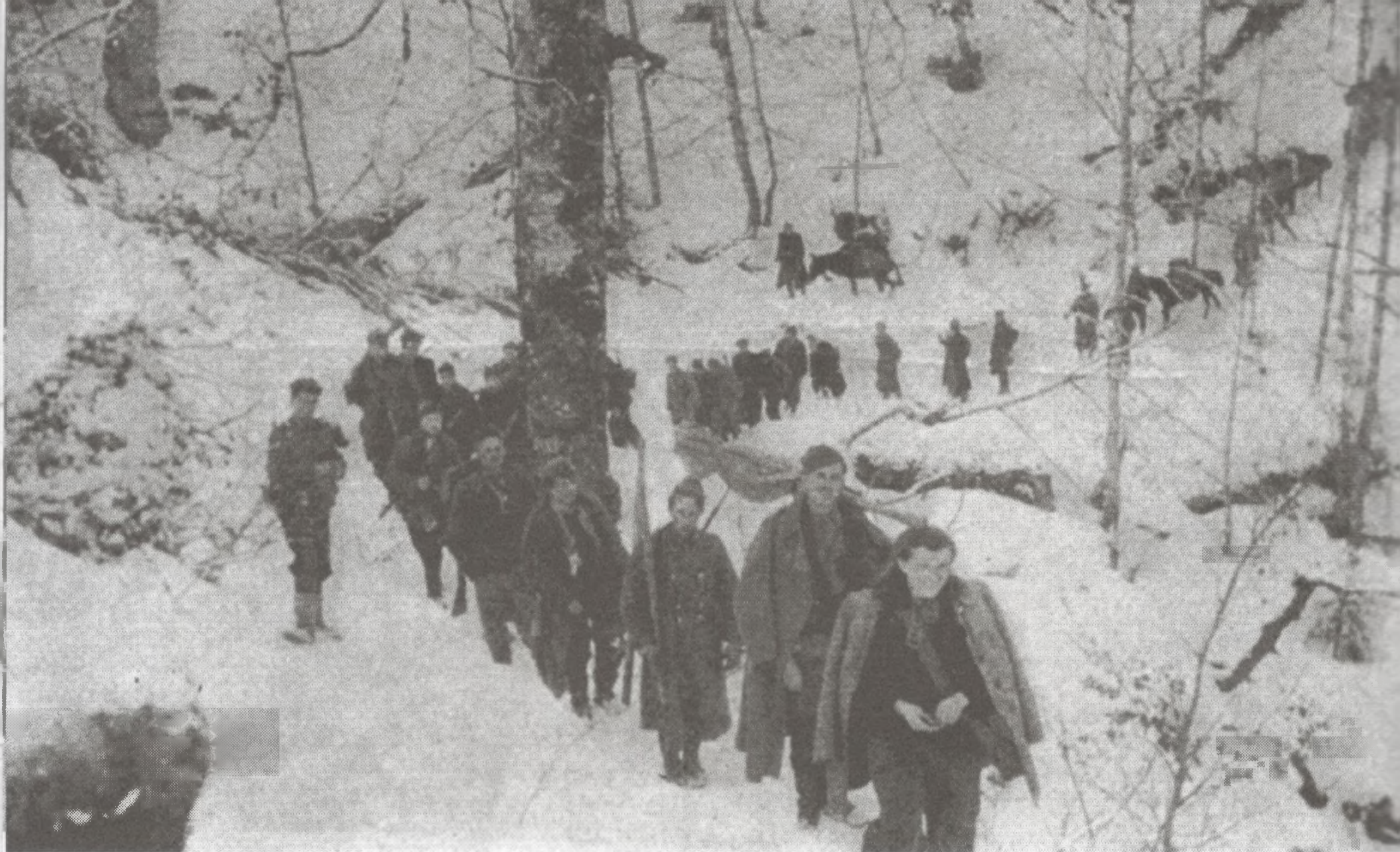
Kolona 6. brigade snimljena početkom veljače 1943. na putu preko Kapele

kvarnerskih otoka i Istre, ali i Like i Korduna te drugih područja Lijepe naše. Prisjećajući se te obljetnice odajemo počast svim borcima koji su se spremno odazvali pozivu za obranu svojih ognjišta od nacifašističkog zavojevača i domaćih izdajnika i koji su osigurali, kao dio najveće partizanske vojske u tadašnjoj okupiranoj Europi, i kasnije pripojenje dijela naših krajeva koji su bili pod talijanskom okupacijom i pridonijeli oslobođenju cijele zemlje.